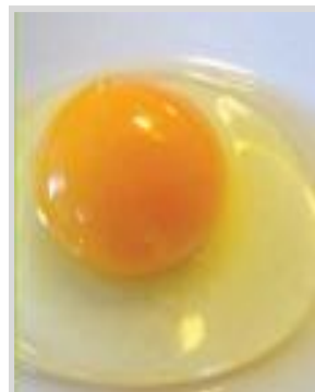
ביצה טרייה מאוד