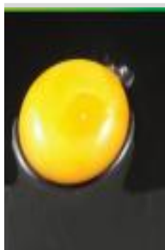
ביצה שהוטלה לפני שבוע ויותר